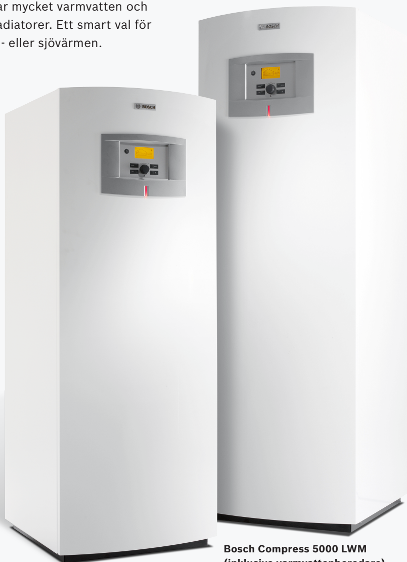
Bosch Compress 5000 LW (exklusive varmvattenberedare)